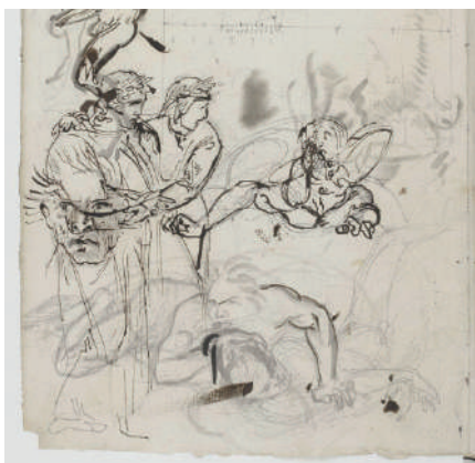
Eugène Delacroix (1798-1863), carnet de notes et de dessins où les motifs s'entremêlent et se chevauchent.