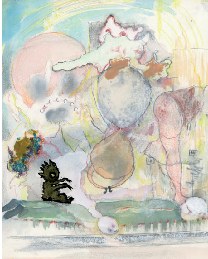
Christian Lhopital, Vitrine 2 , 2020, 30 x 21 cm.

C'est en suivant ces différents espaces proposés par l'artiste que ce dossier pédagogique se développe. Il insistera sur la diversité technique et formelle qu'offre le dessin. Médium longtemps relégué au rang d'outil préparatoire, le dessin est pourtant une pratique accessible à tous qui laisse émerger l'inconscient et l'imaginaire de chacun.