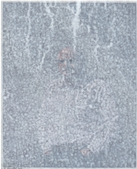
Christian Lhopital, Fixe face silence_35 , 2017, crayon, peinture, collage sur papier, 185 x 127 cm.

COMPLÈTEMENT RECOUVERTS d'une pellicule opaque, les dessins de la série Fixe, face silence fascine et sidère tout en même temps. L'artiste travaille à partir d'un portrait sélectionné et découpé dans la presse, qu'il recouvre ensuite de gesso, généralement utilisé pour apprêter la toile du peintre mais ici étendu pour supprimer tout espace et tout contexte. Seul persiste une silhouette en transparence et la fixité du regard, soulignés par le crayon à papier.