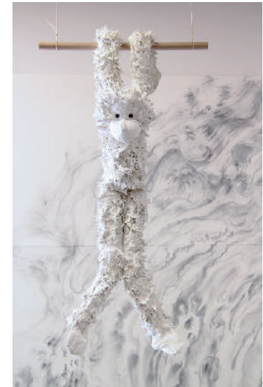
Christian Lhopital, Toucher terre , 2020, peluche, bois, peinture, ficelle, 82 x 44 x 28cm.

Les peluches qu'utilise C.Lhopital ne sont jamais des objets qui ont été utilisés par des enfants. Ce qui l'intéresse c'est la multiplicité et la mondialisation de l'objet peluche.