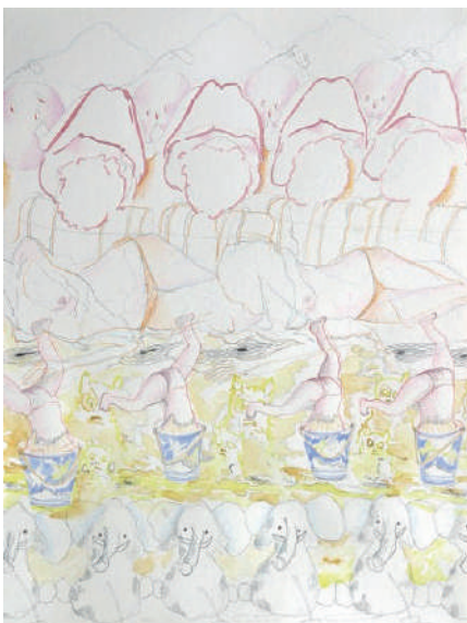
Christian Lhopital, Après-demain 7 , 2005, technique mixte sur papier, 40x30cm.

" Cette série s'inspire du cinéma que j'aime beaucoup. Mais à la différence des films, c'est la circulation du regard dans l'image fixe qui crée le mouvement." CL