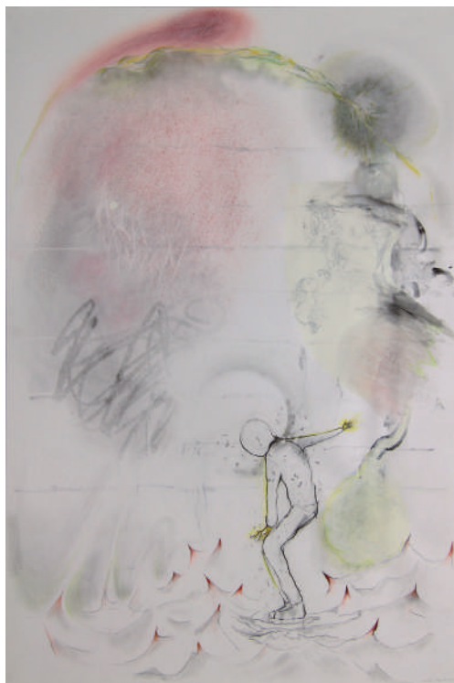
Christian Lhopital, Solo 7 , 2018, technique mixte sur papier, 110 x 75 cm.

Films, livres, musiques, nourrissent l'inspiration de Christian Lhopital et enrichissent ses dessins de multiples références. L'univers de la scène et du spectacle vivant y est omniprésent. Les personnages de trois-quart ou de profil semblent vus depuis les coulisses ou le parterre des spectateurs. L'ESPACE SCÉNIQUE est esquissé par quelques traits évoquant des plans.