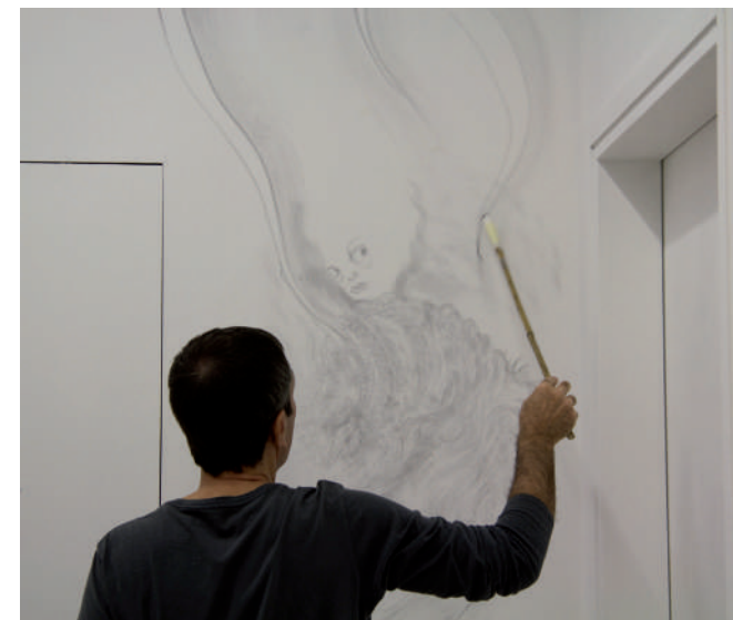
Christian Lhopital, Danse de travers , 2018, dessin mural à la poudre de graphite (en cours d'exécution).

Plinie l'ancien rapporte la légende de l'origine du dessin. Dibutade, une jeune Corinthienne, fille du potier Butadès de Sicyone souhaite conserver pour toujours l'image de son fiancé partant à la guerre. Elle fixe alors avec du charbon les CONTOURS de l'ombre portée du visage de son amant, projetés sur le mur par la lumière de la lanterne. Elle «invente» ainsi, d'après la légende, l'art du dessin. Chez Lhopital le dessin se construit aussi à partir des contours. Tracés à la poudre de graphite, des vides et des espaces laissés vacants, font naître des figures.