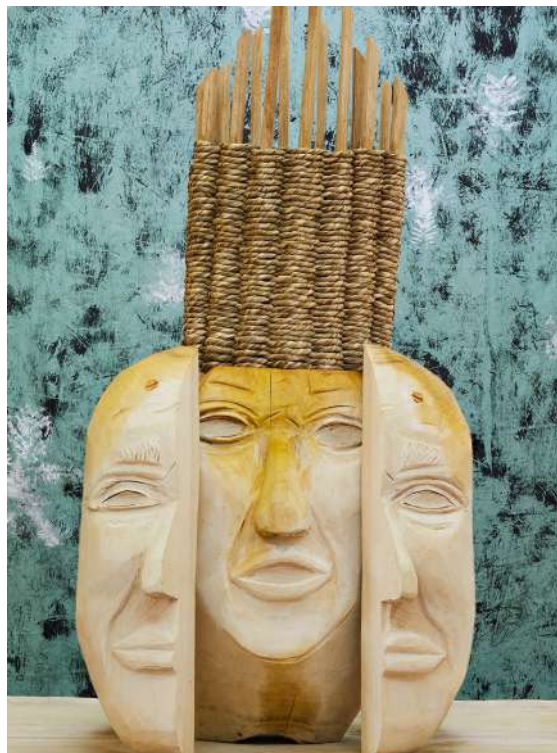
Aurélie Ferruel et Florentine Guédon, Sculptures sur table , 2018, 80 x 100 cm, production Ateliers des Arques.

Entre célébration joyeuse et chasse aux faux-semblants du folklore, Ferruel et Guédon s'appliquent, avec beaucoup d'humour, à rendre une forme vivante aux traditions, y compris celle, paillardes, qu'une certaine bienséance intellectuelle tend à honnir de nos jours.