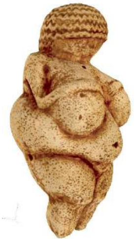
Statue callipyge de Willendorf , découverte en 1908, Musée d'histoire naturelle de Vienne.

Modelée grâce à un procédé qui remonte à la Préhistoire, la terre cuite est associée à la sphère féminine, la terre nourricière et fertile.