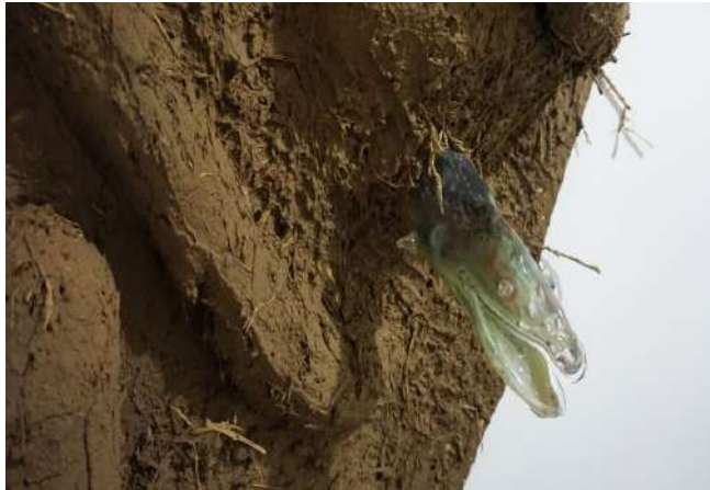
Tripailles , 2019, verre soufflé et torchis, 60 x 100 cm.