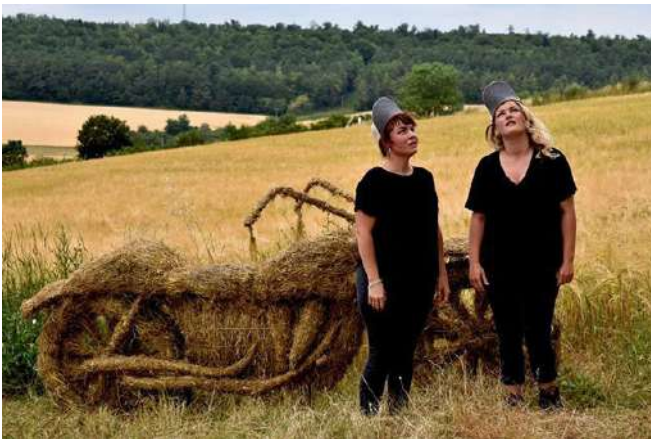
Les Rondes , 2018, foin et métal, 300 x 90 x 90 cm.

Les artistes abordent la question des rituels de façon transgressive et régressive. Le mélange des matériaux et des formes contient une dimension grotesque et paillarde, comme pour l'oeuvre Les Rondes . Si la moto est souvent synonyme de vitesse, de liberté et de virilité, il n'en est plus du tout question ici. La sculpture possède toutes les caractéristiques d'une moto traditionnelle (dimensions, volume...) mais a perdu sa force charismatique: sa texture en foin est flasque, lui donnant un caractère GROTESQUE .