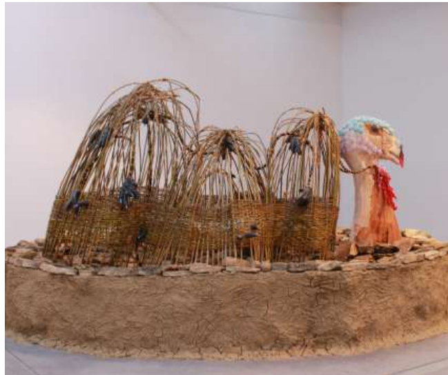
Aurélie Ferruel et Florentine Guédon, La suée du dindon , 2020, paille, terre, bois, verre, céramique, 500 x 300 x 250 cm.

Être le DINDON DE LA FARCE signifie "se faire duper". Au Moyen-Âge, les « farces » étaient de courtes comédies qui mettaient en scène des pères crédules, bafoués par leurs fils. Ils étaient déguisés en dindons, devenant ainsi les « dindons de la farce ». Les animaux de basse-cour sont souvent sollicités pour évoquer un individu moqué dans un groupe social : l'âne, le bouc, la dinde... Chez Ferruel et Guédon, le dindon est démembré au centre du lavoir, il ne reste de lui plus que la tête en bois, la gorge en perles de verre rouge et les pattes en céramique. Les artistes évoquent aussi l'évolution de cet animal, domestiqué à tel point qu'il n'est plus capable de se reproduire sans l'aide de l'homme.