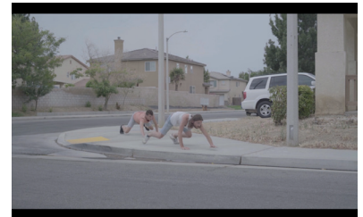
Lola González, Les anges , 2017, vidéo couleur HD, 14'

The Fine Art Collection sera en résidence dans les écoles primaires de Valentigney dans le cadre d'un dispositif CLEA de janvier à juin 2018.