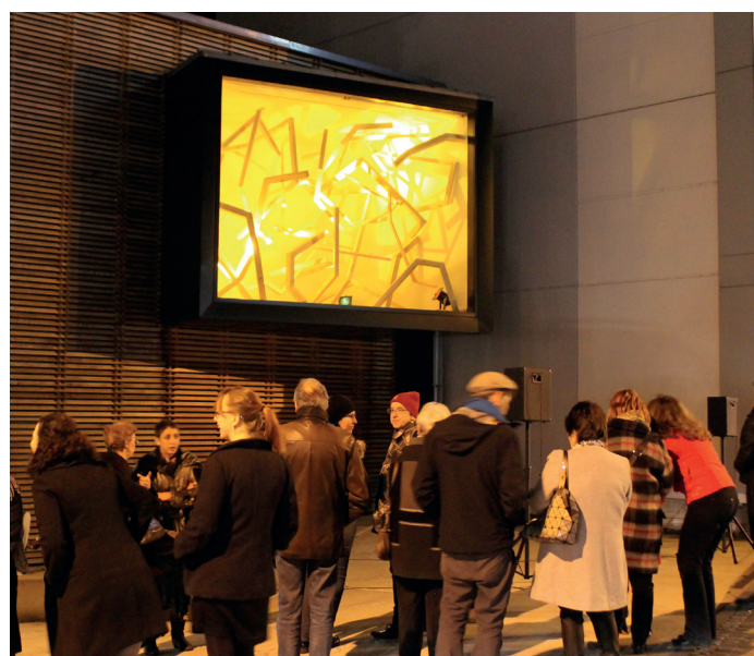
LA BOX DE NOËL, 2016