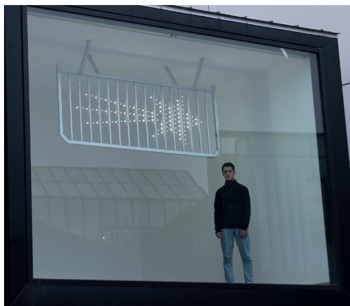
BOLIDE, 2018

Du 4 décembre 2026 au 3 janvier 2027 > Exposition