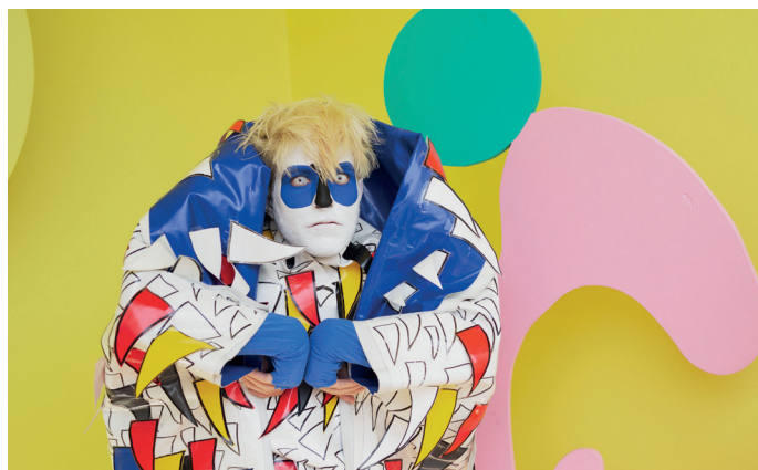
PERFORMANCE DANSE STATIQUE, 2020

Dans le budget prévisionnel à joindre au dossier, la rémunération artistique devra être intégrée. Les candidat-es sont invité-es à détailler le plus possible la répartition des frais de production.