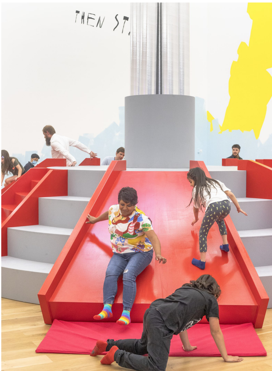
Assemble, The Place We Imagine , 2022. © Julian Hughes.