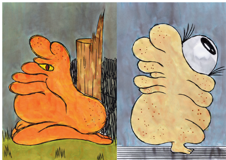
Frédéric Fleury, Farine , 2010.