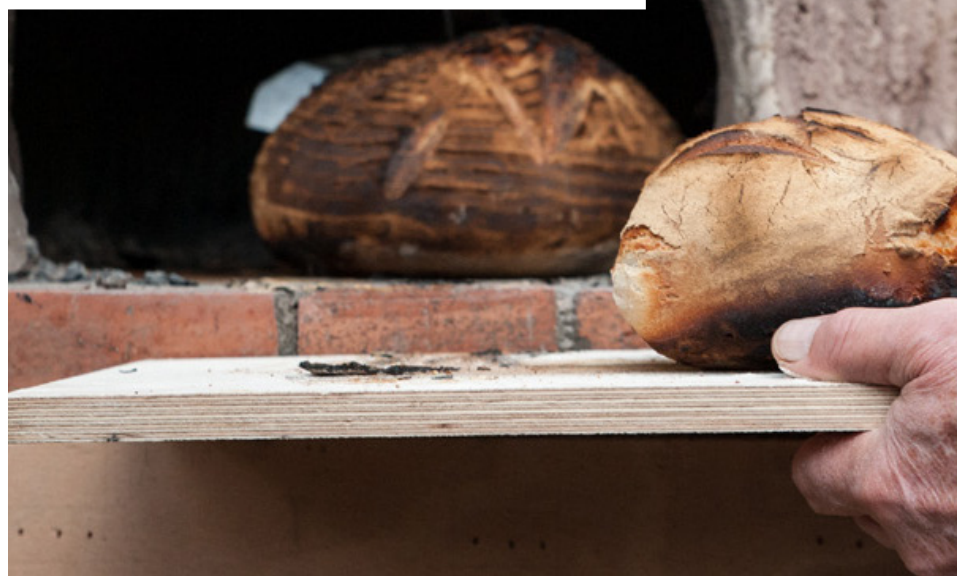
Marie Preston, Marques à pain , 2019. © Marie Preston et Céline Bertin.