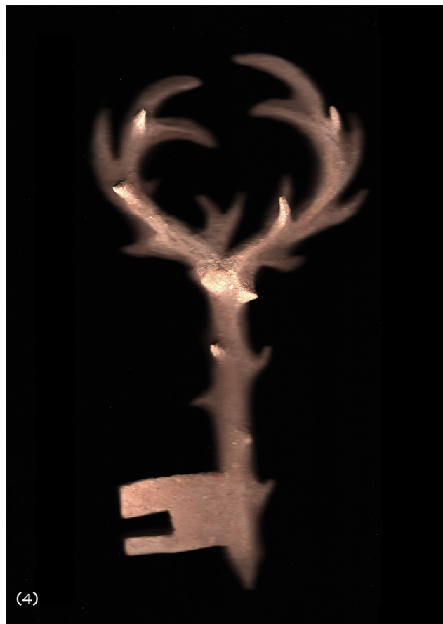
(4) Bienvenue [Clefs] , modelage en grès, terre cuite, 100 x 200 mm, trois pièces uniques, HEAR Strasbourg, 2022 © Léa Chemarin