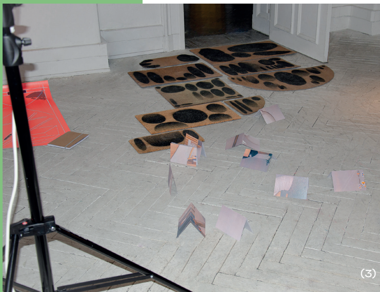
(3) - Bienvenue , vue de l'installation, lecture performée, HEAR Strasbourg, 2022.