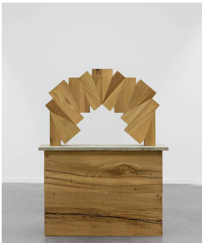
Raphaël Zarka, Les prismatiques , 2013. Chêne ressuyé et béton, 151x99x36cm

Fiche pédagogique réalisée par Sylvie Daval, professeure d'arts plastiques, chargée de mission au 19, Crac de Montbéliard. dans le cadre de l'exposition Prismatiques, stratégie des petites faces , du 27.02 au 30.04.2021