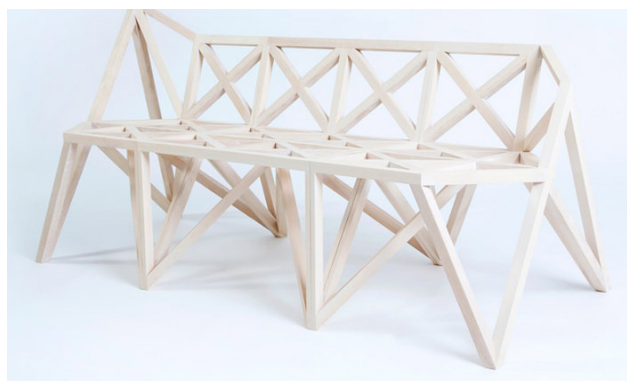
Bridge, Banc en bois, collection de meubles conçus par les designers du Studio Variant