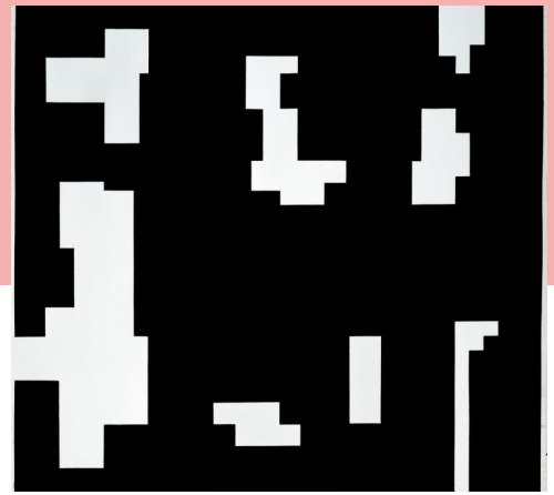
Nombre et Hasard (V 154), 1991, peinture vinylique sur papier, 51 x 51 cm

Carrés. Rectangles. Juxtapositions complexes. Colorations et contrastes. Nemours souhaite « installer le vide », selon ses propres mots. L'aboutissement de ce travail de rigueur, ira vers une ascèse limitée aux carrés et rectangles noirs ou gris, travail de l'espace et de la matière.