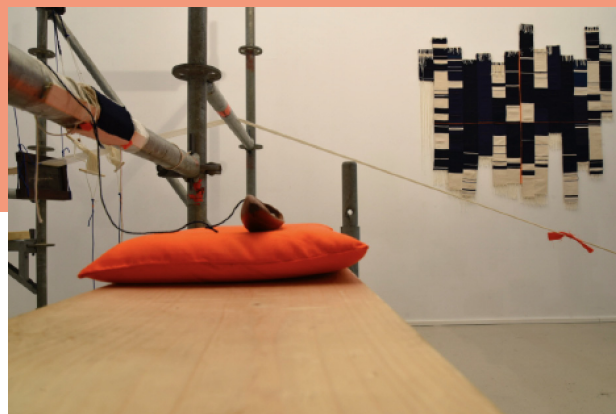
Vue de l'exposition Indexmakers , au 19 Crac, du 23 sept. 2017 au 7 janv. 2018.

d'un échafaudage, structure urbaine. Installé dans un quartier d'Audincourt en été 2017, il a réuni les personnes habitant aux alentours, venues tisser en plein air et échanger entre elles leur parcours, leur mémoire, leur patrimoine... Cette action a permis de valoriser un espace public souvent considéré comme mineur, et de rassembler des populations diverses. Les pièces de tissus qui en ont résulté sont en quelque sorte les témoignages de leurs conversations et les symboles des liens tissés. Elles ont été présentées au 19, Crac dans le cadre de l'exposition Indexmakers .