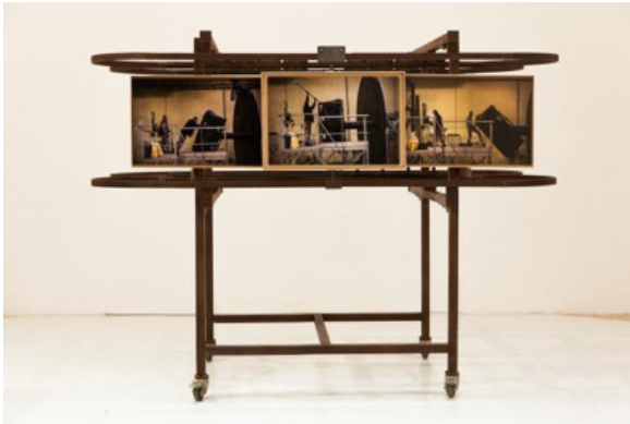
A la poursuite de l'extension des échanges, un clair-obscur qui tarde, 2014

Pratiquant une forme quasi sociologique de l'art, Serge Lhermitte explore et analyse l'impact essentiel de phénomènes sociaux. Il propose des images réflexives, où les espaces privés et publics se replient l'un sur l'autre. Si dans son travail il tourne le dos à une photographie documentaire, il tient aussi à se démarquer d'une photographie plasticienne dans sa mise en exposition. Pour chacune de ses séries, il crée des modes de monstration singuliers, qui permettent une nouvelle manipulation des images.