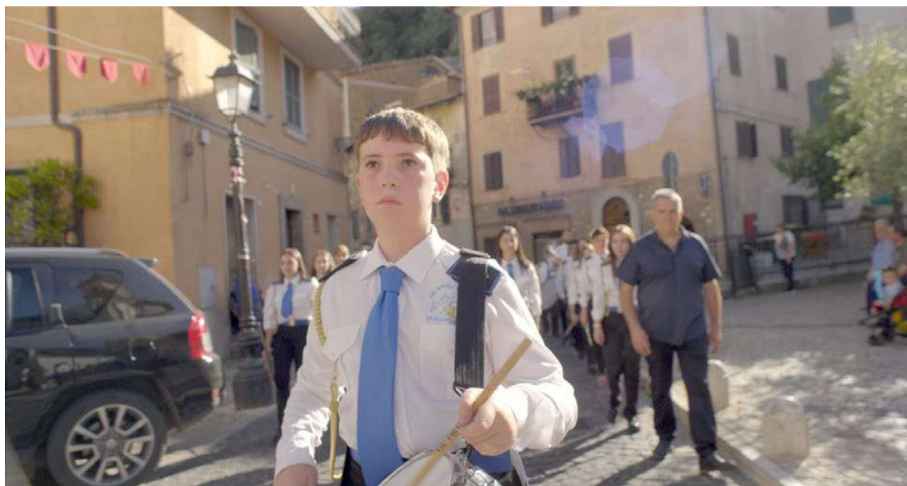
Image 1 : La Banda , 2024 © Annika Kahrs - Image 2 : Le Chant des Maisons , 2022 © Annika Kahrs Video stills : Courtesy of the artist, Annika Kahrs & Produzentengalerie Hamburg