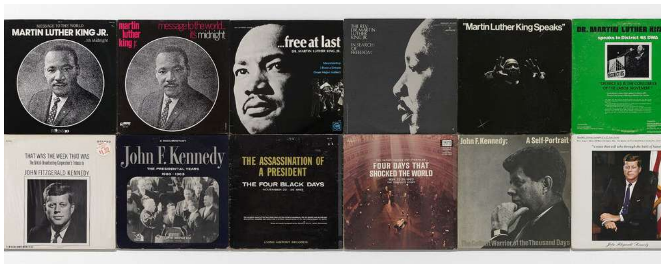
An Ear to the Sounds of Our History (MLK/JFK), 2011 © Sharon Hayes - Vue partielle de l'oeuvre - Crédit photo : Blaise Adilon (détail)

➔ Imaginer des univers nouveaux. Découvrir des œuvres proposant la représentation de mondes imaginaires ou utopiques. - 5e