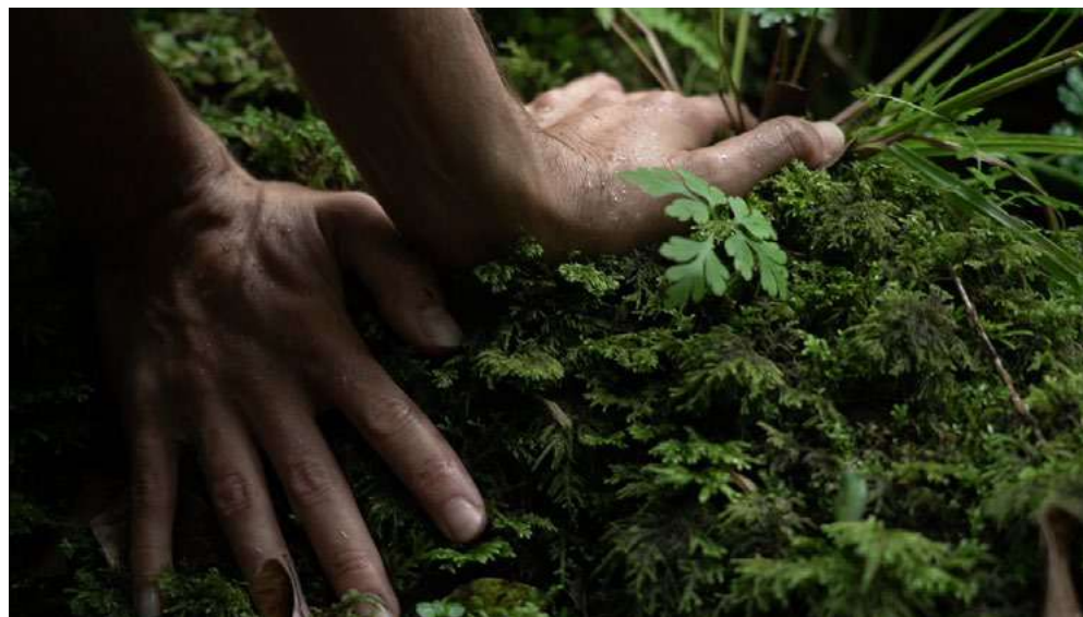
Image 1 : Remonter les rivières, 2023 © Laura Molton, film-installation 60 min, collection Frac Occitanie Montpellier