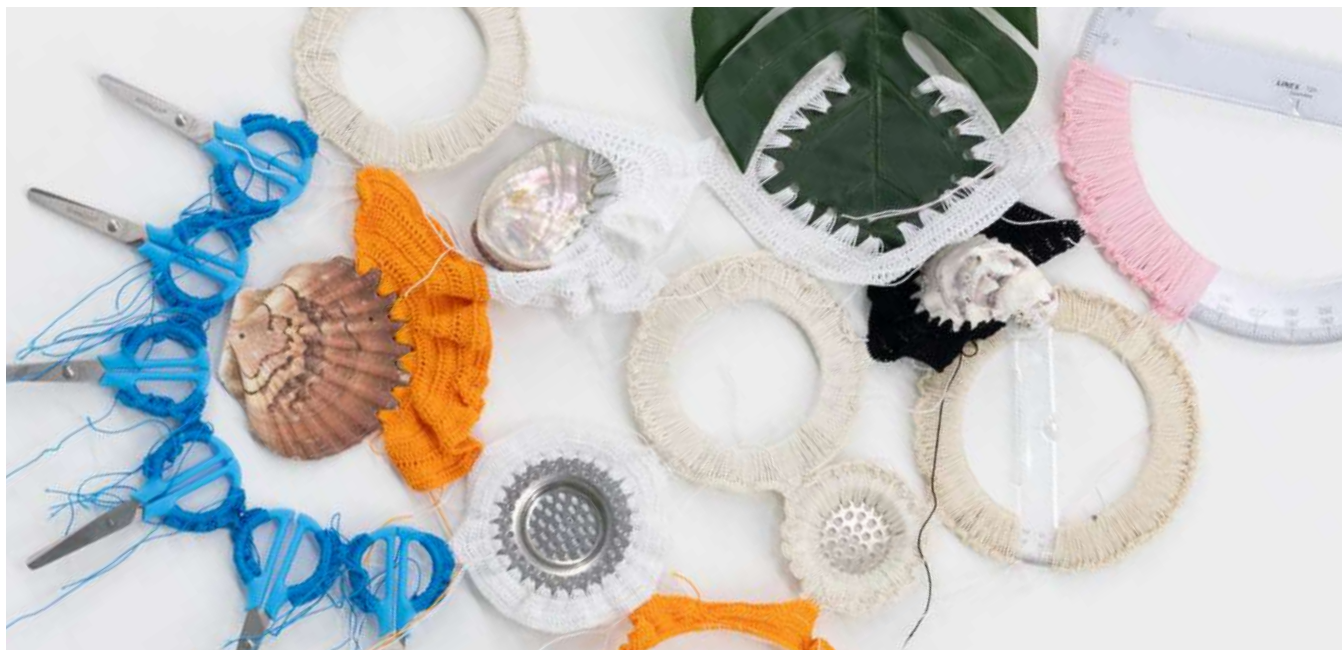
Assemblage 1, 80 x 50 cm, 2023 - Courtesy de l'artiste Silvana Mc Nulty et Galerie Florence Loewy © ADAGP, Paris, 2026 - Crédit photo : Vincent Blesbois