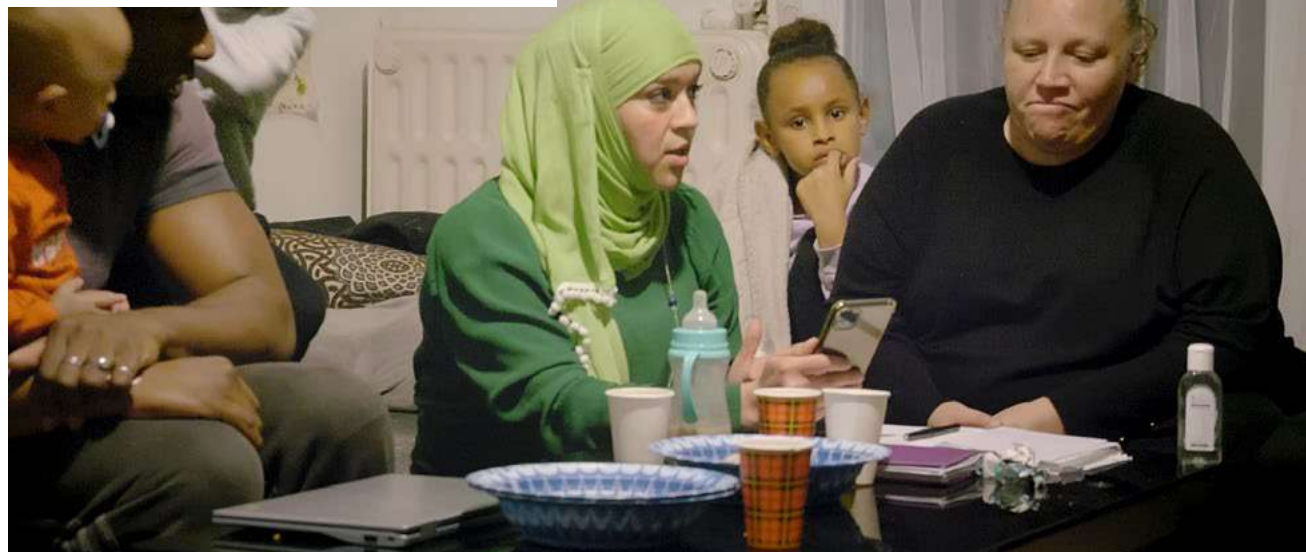
Aujourd'hui, on est là © Erika Roux – trois vidéos HD, installation, 20'10", 2021