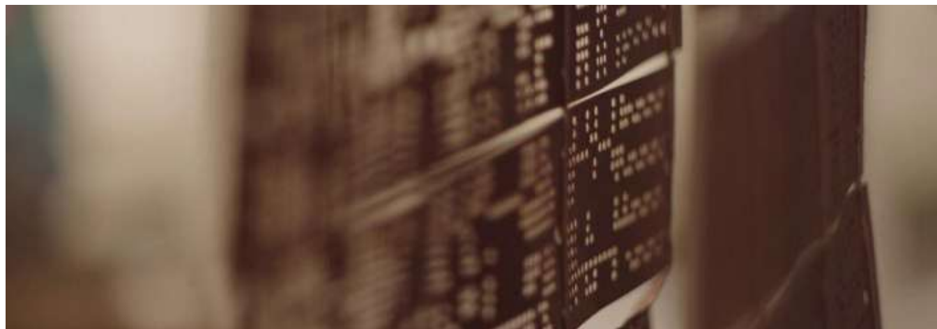
Le Chant des Maisons , 2022 © Annika Kahrs Video stills : Courtesy of the artist, Annika Kahrs & Produzentengalerie Hamburg

➔ La mise en regard et en espace / Le dispositif de présentation. La présentation de l'œuvre (installation, in situ , intégration à des lieux existants...) - Cycle 3 et 4