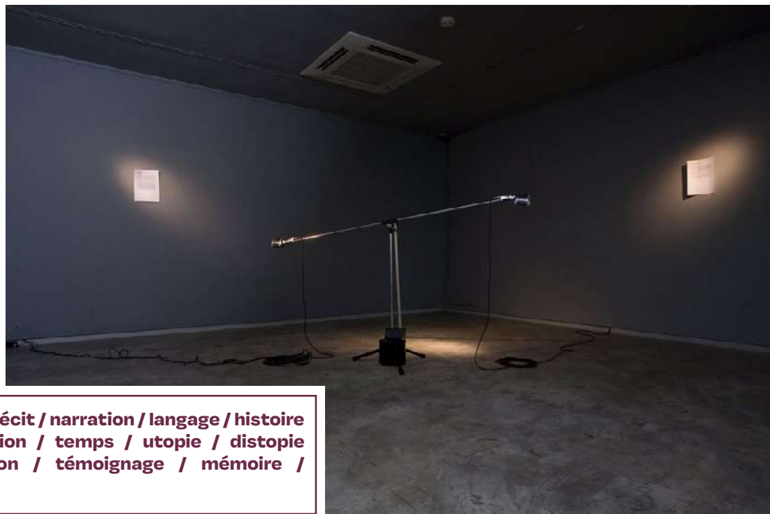
In Our Times , 2008 © Shilpa Gupta