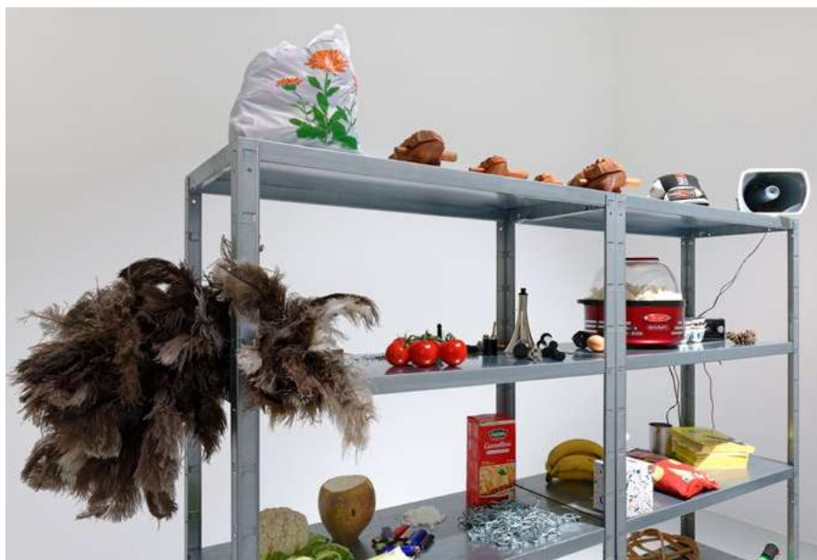
Lawrence Abu Hamdan, Earwitness inventory , 2018, Collection Frac-Franche-Comté © Lawrence Abu Hamdan, crédit photo : Blaise Adilon

Cette exposition interroge aussi comment une collection devient à son tour la narration de notre époque , quand elle se raconte à travers les œuvres qui la composent.