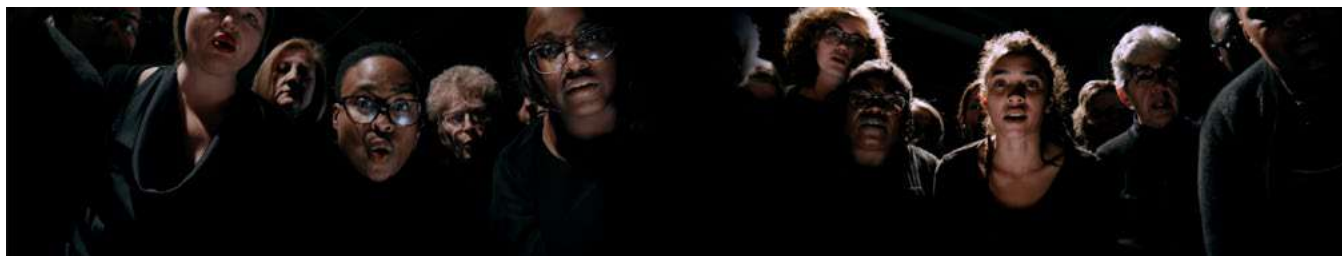
Sounding Labor, Silent Bodies. Industries, Contemporary Arts Center, Cincinnati, 2020. Crédit photo : Prince Lang Video stills : Courtesy of the artist, Tania Candiani

➔ Françaises et français dans une République repensée. La société des années 1950 à 1980 : nouveaux enjeux sociaux et culturels. - 3e